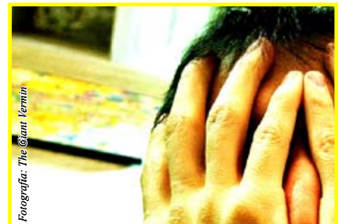
No se amargue, si sigue los pasos, puede pedir y recibir una tarjeta.

Mantenga su tarjeta en un sitio seguro, es un documento importante. No la lleve en su cartera.