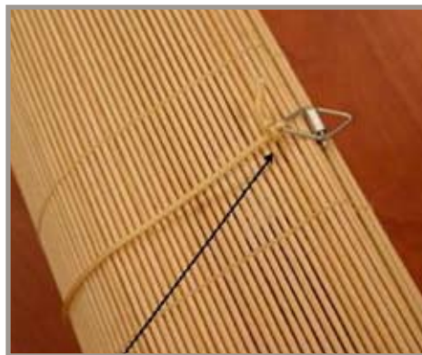
Persiana enrollable sin broches de liberación Está incluida en este retiro del mercado