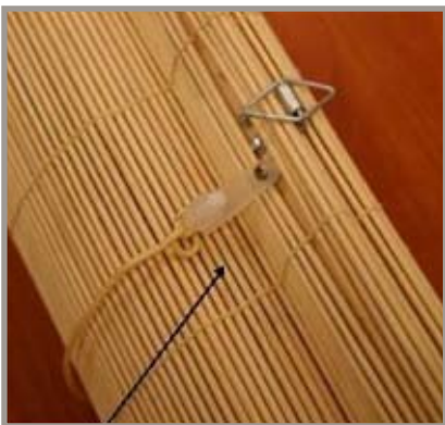
Persiana enrollable con broches de liberación NO está incluida en este retiro del mercado

Quienes compraron estas cortinas o persianas deben dejarlas de usar inmediatamente y llamar al Window Covering Safety Council (Consejo de Seguridad de Cubiertas para Ventanas, WCSC ) para pedir juegos de reparación gratis al (800) 506-4636, a cualquier hora.