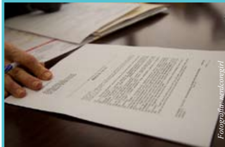
Engañarse a uno mismo (y al banco) al comprar una casa, suele ser desastroso

Casas sin pago inicial. Esta ventaja estuvo de moda precisamente cuando la crisis hipotecaria estaba en su peor momento. El problema de comprar una casa sin un pago inicial o dowpayment , es que el comprador necesita prestarse todo el dinero, y eso hace que pague más dinero en intereses,