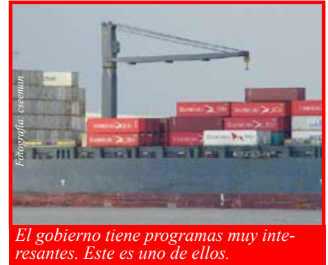
El gobierno tiene programas muy interesantes. Este es uno de ellos.

La solicitud de Asistencia por Ajustes Comerciales puede ser realizada en grupos de tres o más trabajadores, a través de un representante de la compañía, a través de operadores de los centros de empleo que suelen encontrarse en los centros comunitarios en las ciudades del país, llamados One-Stop Career Centers ; a través de las agencias de seguridad laboral y unidades para trabajadores desplazados, o bien, a través de algún sindicato o