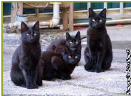
También los animales salvajes suelen andar perdidos.

Por lo contrario, en el caso de encontrar un animal herido, la acción debe ser inmediata. Si se trata de un animal