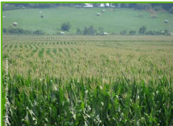
Los granjeros que han sufrido una pérdida grande, podrían tener esperanzas.

Para obtener más información sobre este programa, visite en Internet (en inglés): http://www.doleta.gov/tradeact