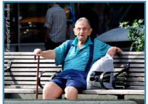
No es fácil evitar ser discriminado por la edad, pero podría evitarlo conociendo la ley americana.

4000 (línea gratuita). Puede también encontrar información sobre las sucursales de la Comisión en el Internet: www.eeoc.gov o en la mayoría de las guías telefónicas en la sección Gobierno Federal o Gobierno de los Estados Unidos.