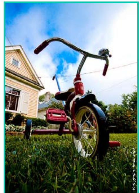
Los juguetes a veces se constituyen en peligro. Entérese de cuales se ha determinado como peligrosos.

Los triciclos fabricados después del 16 de junio de 2010 no están incluidos en este retiro del mercado, puesto que tienen una llave modificada en forma de letra D sin relieve (ver fotografía) y un número de prueba del fabricante superior a 1670Q2. El número indica que el triciclo fue fabricado el día 167 de 2010, es decir, el 16 de junio de 2010. El número de prueba se encuentra debajo del asiento, después del número de modelo.