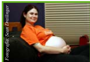
La ley protege a la mujer embarazada