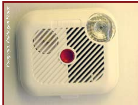
Las alarmas de humo y monóxido de carbono se parecen a esta. Pueden salvar su vida

su casa, entre ellos, los generadores portátiles.