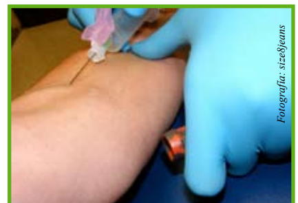
Profesiones que siempre están en demanda