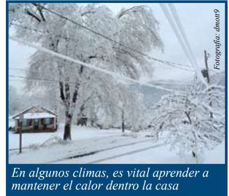
En algunos climas, es vital aprender a mantener el calor dentro la casa

los estándares de protección contra el plomo. Estas zonas tienen un plazo de tres años para nivelarse con el resto del país.