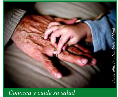
Conozca y cuide su salud

En el Instituto Nacional de la Artritis y las Enfermedades Musculo-