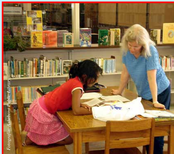
Existe ayuda para reforzar la escuela

Si usted está interesado en buscar este servicio, consulte en la escuela o en su distrito escolar, acerca del programa “No Child Left Behind” y los Servicios Educativos Suplementarios.