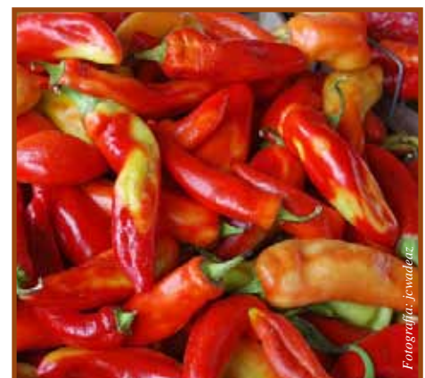
Alto contenido de vitamina C

Contiene mucha vitamina C y fue utilizado en altamar, en los largos