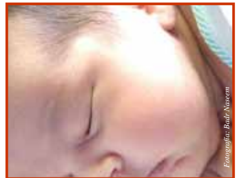
Necesitan cuidado mientras duermen