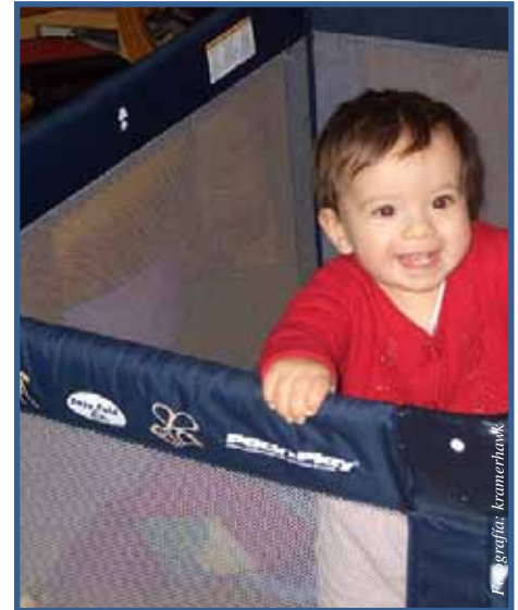
Elimine los peligros del corralito

Es importante que siempre lea las etiquetas e instrucciones antes de usar un producto.