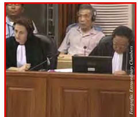
Leyes que buscan la equidad

Este proyecto de ley tiene como objetivo ampliar la cobertura de las categorías protegidas más allá de la raza, el color, la religión o el origen nacional real o percibido, incluyendo aspectos como género, discapacidad, orientación sexual e identidad de género, y sobre todo,