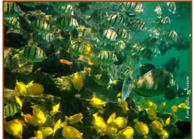
Hay gente que está buscando como pescar su dinero en el internet