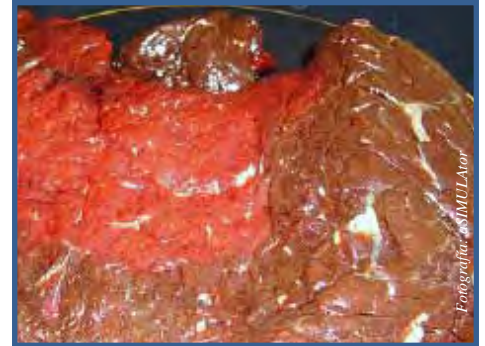
Usted puede evitarlas usando buenos hábitos

formación acerca del manejo adecuado de los alimentos. Para conocerla, llame a la Línea de Información sobre Carnes y Aves del USDA, al 1 (888) 674-6854; o consulte en internet, en: www.fsis.usda.gov