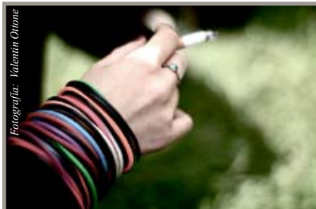
El secreto que atrapa a la gente en este hábito es la nicotina

Se habla mucho de lo dañino que es el cigarrillo y su probado efecto de acortar la vida de la gente que fuma. Pero, ¿por qué es tan difícil dejar este hábito, incluso a sabiendas de que es un suicidio lento? La respuesta está en la poderosa fuerza adictiva que tiene la nicotina - droga que está presente en la planta del tabaco. Estudios recientes explican más claramente el efecto de esta droga en el cerebro.