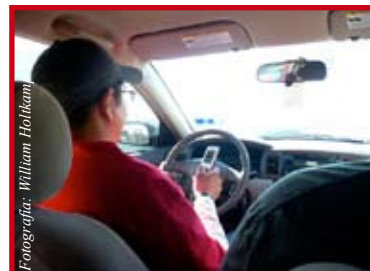
Un error que cuesta vidas a diario

Manejar distraído lo puede convertir en homicida en cuestión de segundos. Antes de usar su teléfono celular, piense si vale la pena este riesgo gigante que está confirmado por todos los estudios de accidentes automovilísticos.