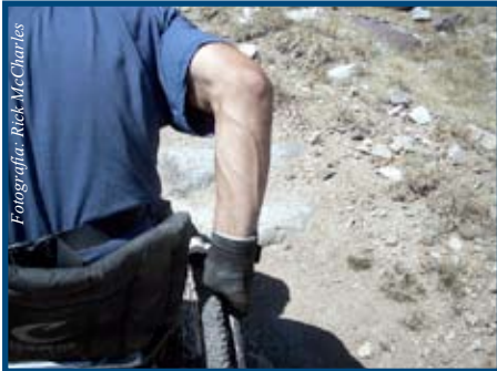
Aprenda como buscar compensación laboral

La discapacidad es algo que puede ocurrirle a cualquiera. Y de hecho nos ocurre a muchos. En el curso de 2010 se reportaron ya más de 8 millones de personas con discapacidad en el país.