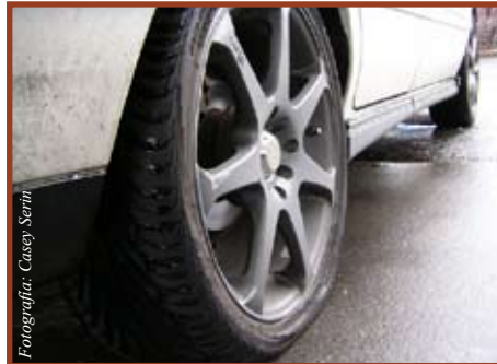
En estas gomas se apoya la vida en la carretera

do. Averigüe el tamaño y tipo de llanta recomendado por el fabricante de su vehículo. Mantenga la presión adecuada. Si conserva sus llantas infladas de manera apropiada, mejorará el rendimiento de gasolina e incrementará la vida útil de sus llantas.