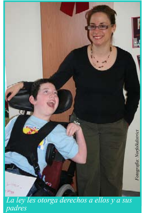
La ley les otorga derechos a ellos y a sus padres

Es importante que explore más sobre sus derechos en el proceso de la educación especial, pues con este conocimiento, usted contará con la preparación necesaria para participar de manera más activa en la educación de su hijo.