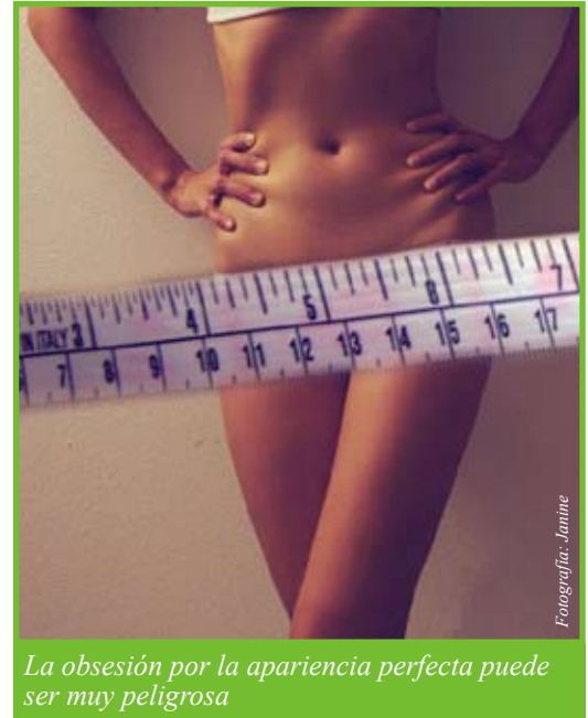
La obsesión por la apariencia perfecta puede ser muy peligrosa

Las personas con bulimia nerviosa, que, por el contrario, comen excesivamente y luego purgan sus cuerpos de los alimentos usando laxantes, vomitando y/o haciendo ejercicio. A menudo actúan en secreto, se sienten asqueados y avergonzados cuando comen en gran cantidad.