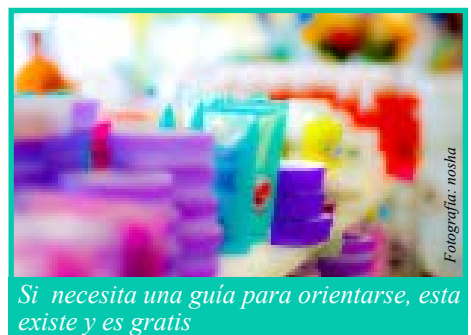
Si necesita una guía para orientarse, esta existe y es gratis