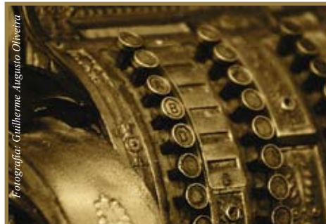
Un préstamo es un compromiso serio: El premio, un buen historial

Este artículo fue una colaboración de GobiernoUSA.gov y la Agencia Federal para el Desarrollo de la Pequeña Empresa.