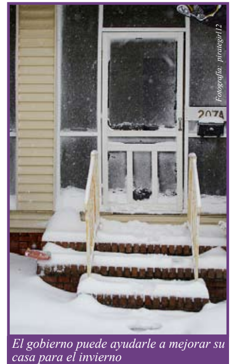
El gobierno puede ayudarle a mejorar su casa para el invierno

Todas estas oficinas son públicas, por lo tanto, el asesoramiento e información que estas le den, no cuestan dinero. Nadie debe cobrarle por estos servicios.