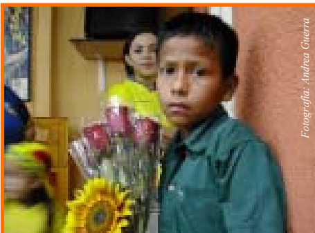
Ámelos y cuidelos pero no piense que son de su propiedad

Por otro lado, los derechos de padre son retirados por vía de la fuerza legal cuando el Gobierno, a través de un proceso (de varias audiencias en tribunales) determina que hay maltrato físico o un descuido continuo. En esta eventualidad, en la que un juez retira los derechos de padres (también conocidos como Patria Potestad), los padres son relevados de sus obligaciones legales para con los hijos.